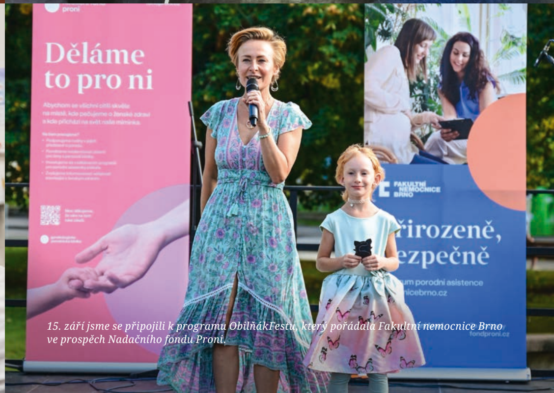
15. září jsme se připojili k programu ObilňákFestu, který pořádala Fakultní nemocnice Brno ve prospěch Nadačního fondu Proni.